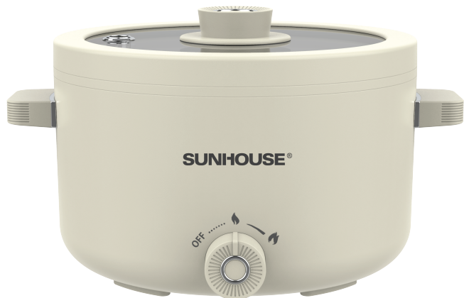
Núm điều khiển