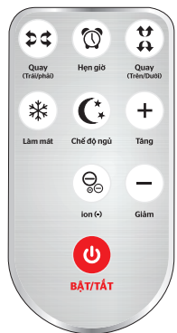
ĐIỀU KHIỂN TỪ XA