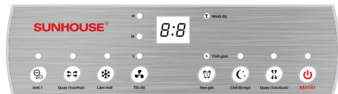
BẢNG ĐIỀU KHIỂN